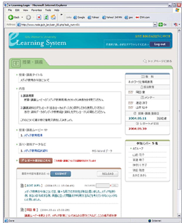
授業・講義内容画面

「授業・講義内容画面」で SUBMIT のボタンをクリックするとその下の掲示板に書き込むことができ、クラス全体やグループのメンバーとの情報交流ができます。