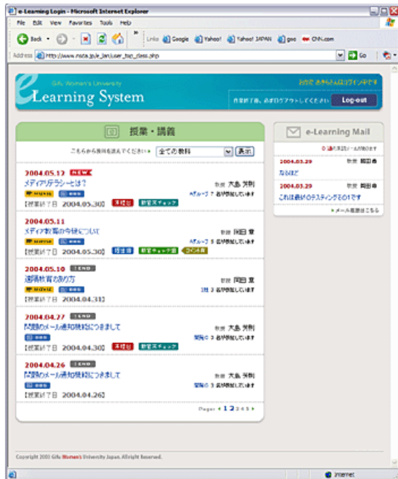
個別学生トップ画面

ここで、授業・講義一覧から授業・課題タイトルをクリックすると「授業・講義内容画面」が表示されます。